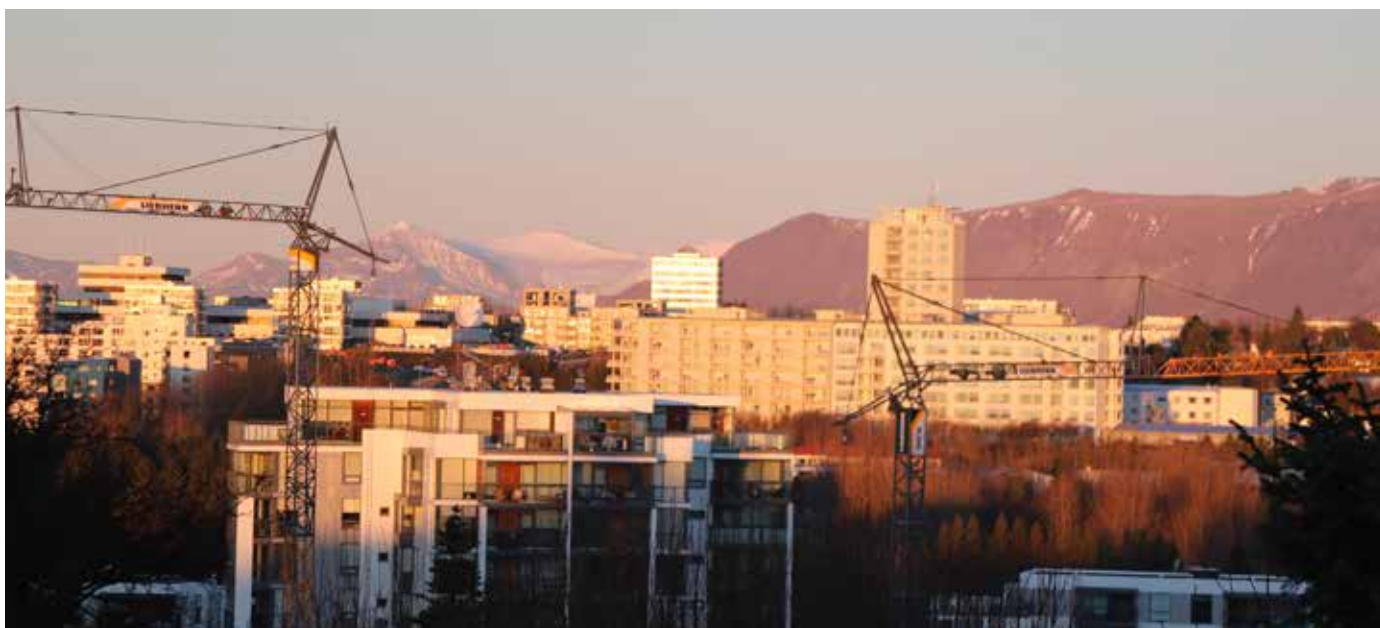
Borgarspítalinn séður frá Álfrólsvogi í síðdegisbirtunni. Það er ys og þys í byggingariðnaði og spítalinn sem var í útjaðri byggðar 1952 er nú orðinn innkróaður.

gleymist að meta arðinn af góðri lækniþjónustu við gerð fjárlaga.“