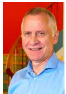
Þórólfur Guðnason, sóttvarnalæknir hjá Embætti landlæknis.