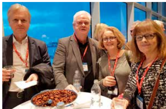
Við setningu Læknadaga, þeir eru einsog Litlu jólin fyrir lækna.