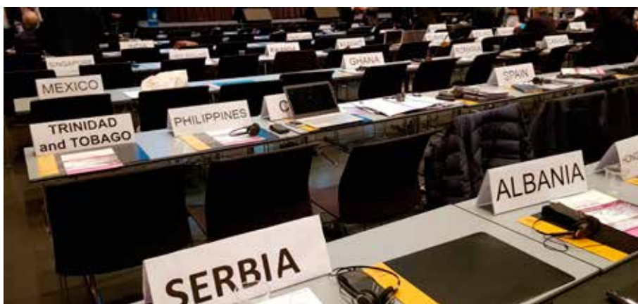
Fulltrúar læknafélaga í 58 löndum áttu fulltrúa á fundinum, og meira að segja Vatíkanið sendi sinn mann á vettvang.

„Alþjóðalæknafélagið, WMA, leggur áherslu á að hlutverk lækna er að taka virkan þátt í að styðja og stuðla að réttindum allra til læknishjálpar sem byggist eingöngu á klínískum þörfum. Þeirra er að mótmæla löggjöf og venjum sem eru í bága við þennan grundvallarrétt,“ segir í tilkynningu félagsins eftir fundinn, sem gekk vel á allan hátt og umgjörðin til fyrirmyndar.