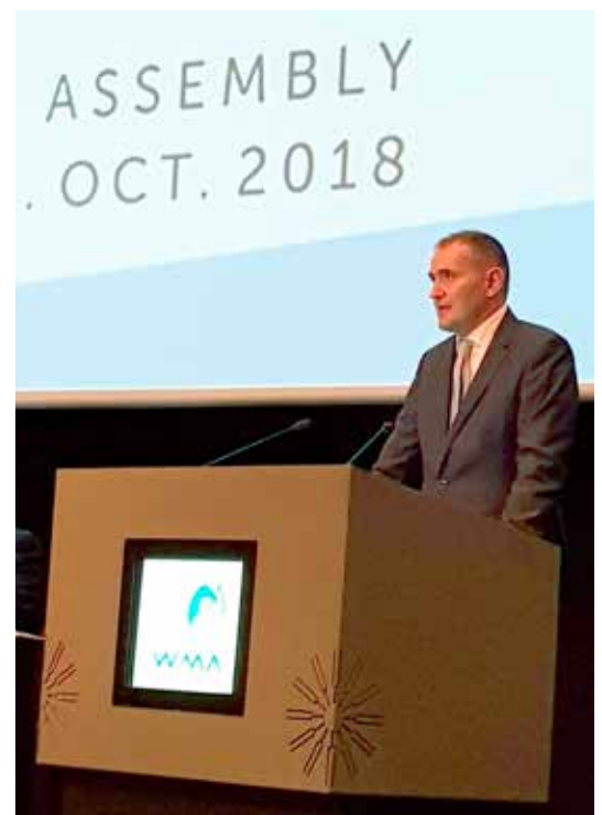
Guðni Th. Jóhannesson forseti Íslands ávarpaði samkomu WMA og spurði: How do you like Iceland?