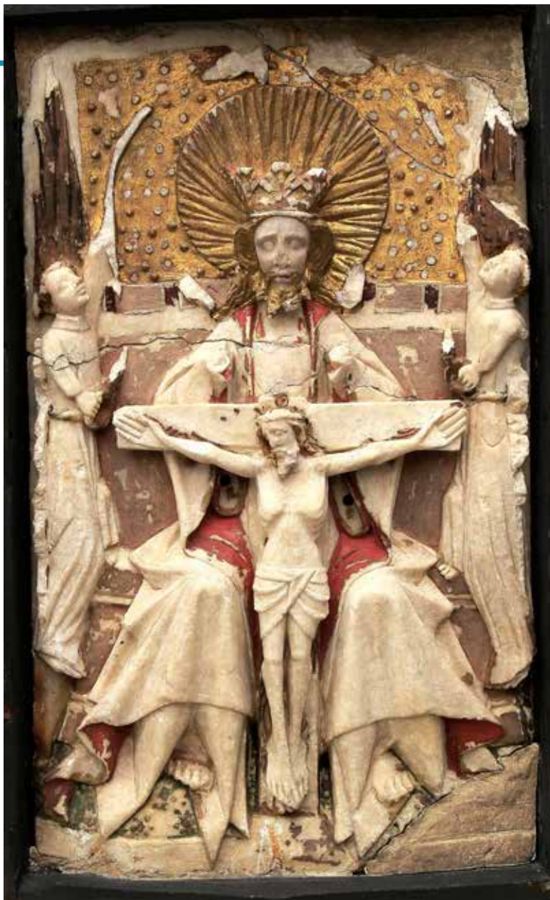
Altaristafla úr Selárdalskirkju í Ketildölum við Arnarfjörð, á slóðum Hrafns Sveinbjarnarsonar. Taflan er gerð úr alabastri, sennilega frá Nottingham á Englandi og mun vera frá því um 1400. Þjóðminjasafnið varðveitir myndina og veitti góðfúslegt leyfi fyrir birtingu.