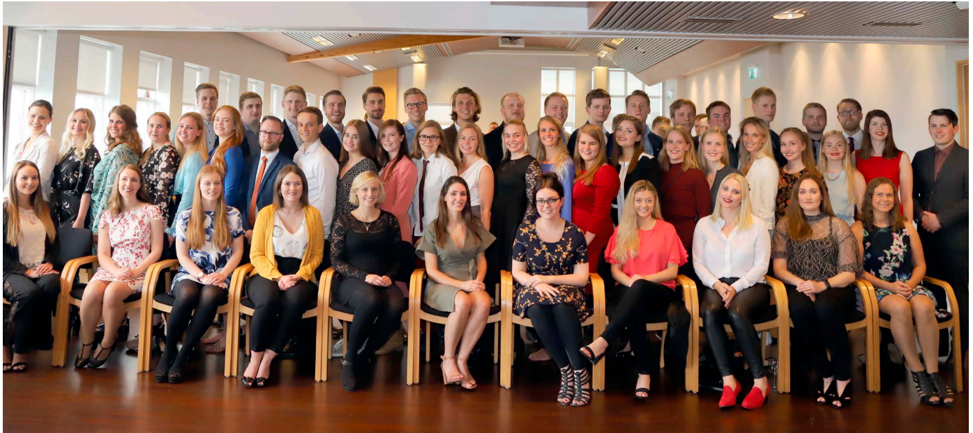
Á myndinni eru 50 kandidatar tilbúnir í slaginn, - hér með taka þeir við hinu íslenska heilbrigðiskefli og koma því svo áfram til næstu kynslóðar.

Danmörku, - og frá háskólanum í Debr-ecen í Ungverjalandi voru brautskráðir 17 íslenskir kandidatar sem er stærsti hópurinn hingað til. Við skólann er fjöldi Íslendinga í læknámi og sá þráður ekki slitinn.