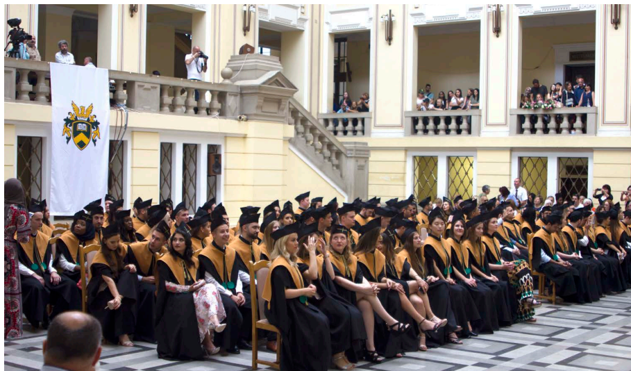
17 íslenskir kandidatar voru brautskráðir frá háskólanum í Debrecen í Ungverjalandi 15. júní síðastliðinn. Hér er hluti þeirra ásamt alþjóðlegum hópi skólafélaga.