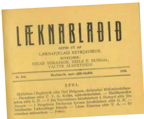
Í Læknablaðinu er skráð og varðveitt tilurð, saga og þróun Læknafélagsins frá upphafi og fram á þennan dag.

Fyrsti aðalfundur Læknafélags Íslands var haldinn á sal Menntaskólans í Reykjavík 1. júlí 1919. Alls mættu 32 læknar og 7