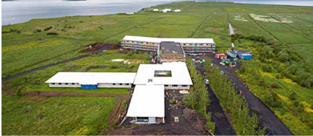
Lofmynd af framkvæmdunum í Vik á Kjalarnesi eins og þær voru á þjóðhátíðardaginn í sumar.