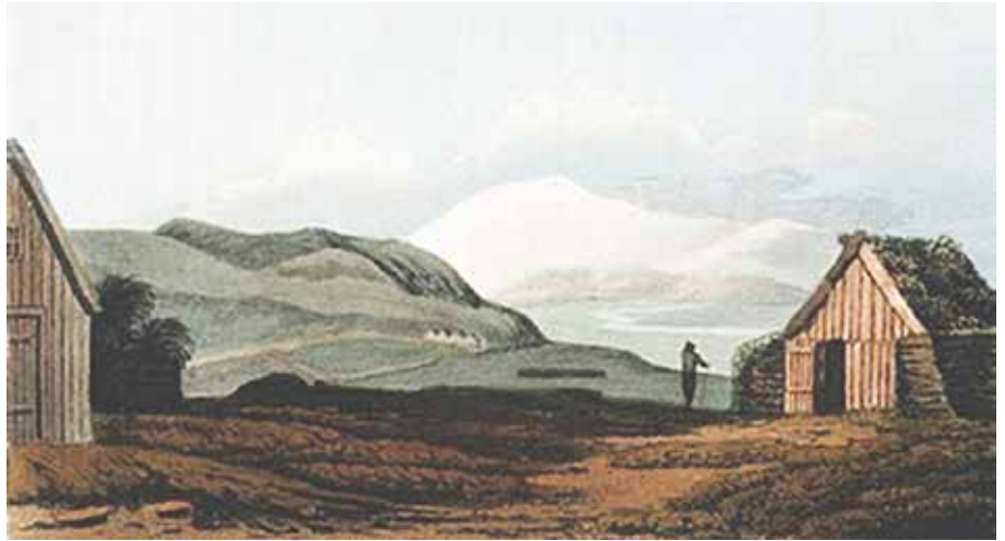
Eyjafjallajökull frá Hlíðarenda