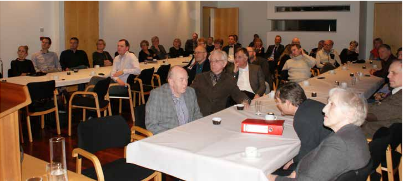
Barnalæknar komu saman í húsnæði læknafélaganna í Hlíðasmára 8 og fóru yfir hálftrar aldar sögu síns félags.

kvenfélag Hringins, en félagskonur veittu verulegu fjármagni til deildarinnar og stuðluðu að hraðari uppbyggingu hennar.