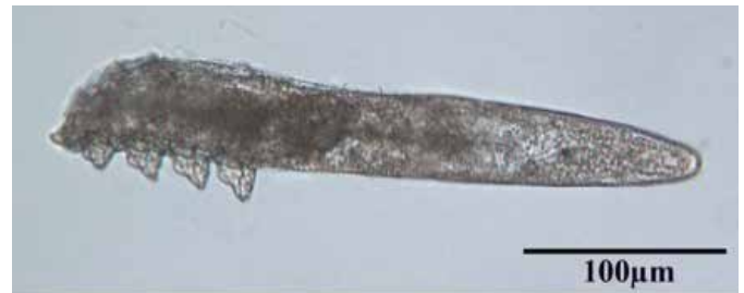
Mynd 2. Hársekkjamítillinn Demodex folliculorum úr íslenskum sjúklingi með hvarmabólgu.

Tíu vikum eftir fyrstu mítlameðferð var liðan í augum góð að sögn sjúklings og kláðinn horfinn. Augnhár voru hrein, ekkert sjáanlegt hrúður. Niðurstöður mítlatalningar (sjá dálk T6 í töflu I) bentu til fækkunar á mítlum. Mælt var með áframhaldandi notkun gervitára án rotvarnaefna eftir þörfum og notkun Tea tree-olíu blautklúta kvölds og morgna.