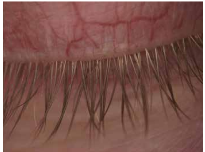
Mynd 4. Tilfelli 2, tíu vikum eftir fyrstu mítlameðferðina.

Talið er að mítlarnir nærast á útþekjufrumum í hárasekkjum og fitukirtlum sem leiði til vanstarfsemi þeirra og þar með ójafnvægis