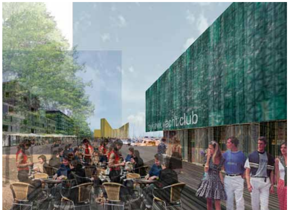
Verðlaunatillagan gerði ráð fyrir skemmtibátahöfn í Nauthólsvík og hér má sjá hugsýn arkitektanna um sumarstemningu á bryggjussvæðinu.