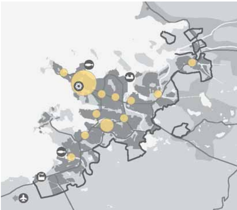
„Í svæðisskipulagi höfuðborgarsvæðisins er skyldri atvinnustarfsemi beint í ákveðna klasa innan svæðisins.“