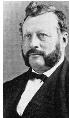
Jón Finsen (1826-1885) beitti fyrstur manna svæfingu við skurðaðgerð hér á landi 1856 og notaði til þess klóróform.