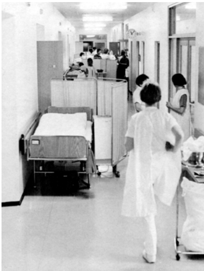
Myndin sýnir þringsli sem oft urðu á göngum lyflækningadeildar vegna sjúklingsafjölda. Mynd úr Arsskýrslu Borgarspítalans 1987, ljósmyndari ókunnur.

Ákveðið var að spítalabyggingin í Fossvogi yrði T-laga þar sem tvær álmur voru einkum ætlaðar sem legudeildir fyrir sjúklinga og ein álma þar sem gert var ráð fyrir röntgendeild, rannsóknadeild, skurðstofum, slysa- og bráðamóttöku og ýmissi annarri starfsemi. Spítalinn var byggður í áföngum og var aðeins önnur legudeildarálman byggð fyrst en hin nokkrum árum síðar. Árið 1978 var byggð álma á þremur hæðum sem hósti slysa- og bráðamóttöku. Þar var einnig rekin heilsugæslustöð frá 1981 í nokkur ár.