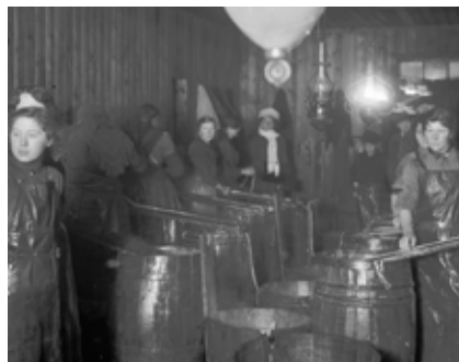
Úr lýsisbræðslu í Reykjavík á fyrsta áratug 20. aldar.