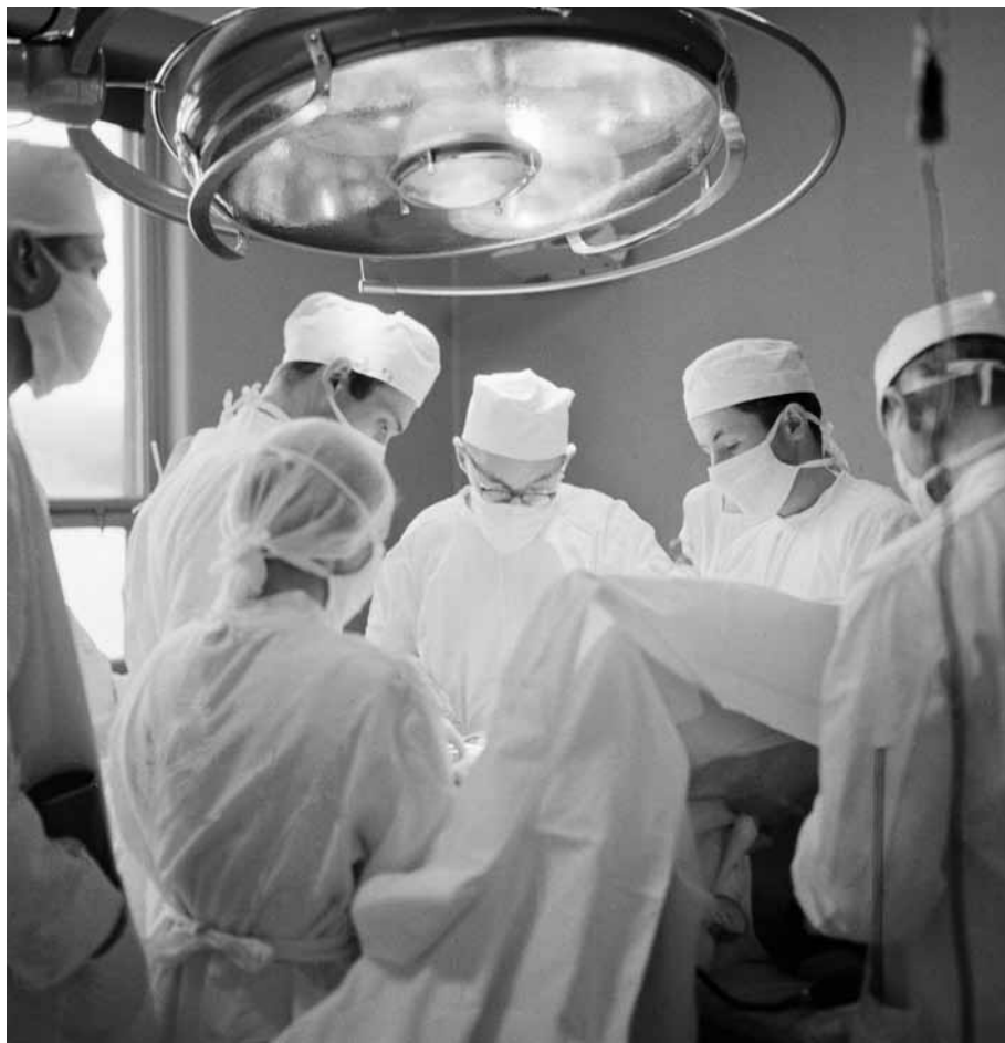
Aðgerð á Landspítala 1958.

Á þessum árum var hvíti liturinn ríkjandi á skurðstofum. Sloppar voru hvítir, svo og húfur, andlitsmaskar og línið sem dúkað var með umhverfis aðgerðarsvæðið. Þetta var allt þvegið og dauðhreinsað og notað margsinis því einnota hlutir höfðu ekki rutt sér til rúms að ráði. Sama er að segja um ýmislegt, svo sem barkaslöngur sem notaðar voru við svæfingar. Aðalsvæfingalyfið var eter.