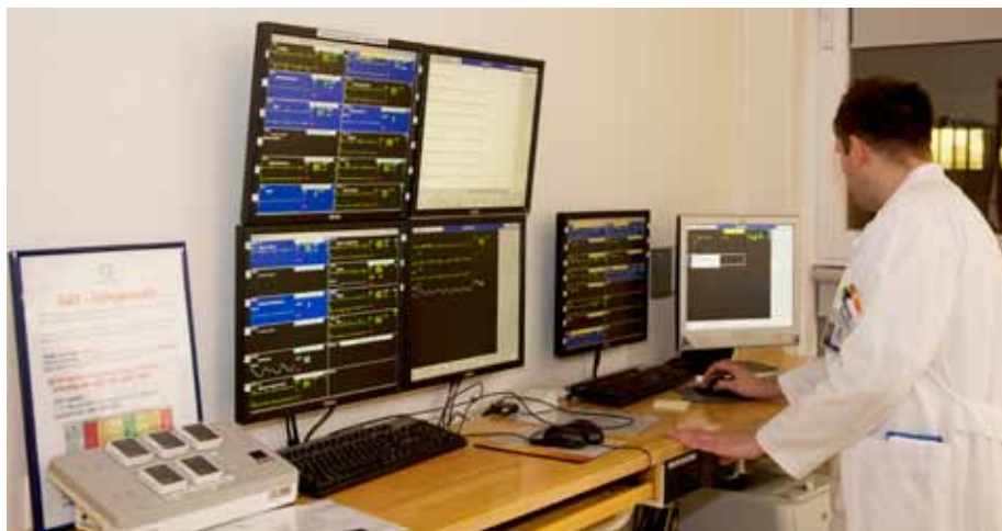
Námslæknir á vakt fylgist með hjartalínuriti sjúklings á stofu.

„Marklýsing námsins er í endurskoðun. Kennslustjórar hafa verið að skoða marklýsingar frá Bandaríkjunum, Bretlandi, Danmörku og Svíþjóð, en umtalsverð þróun hefur verið í framhaldsnámi á öllum þessum stöðum á undanföllum árum. Í