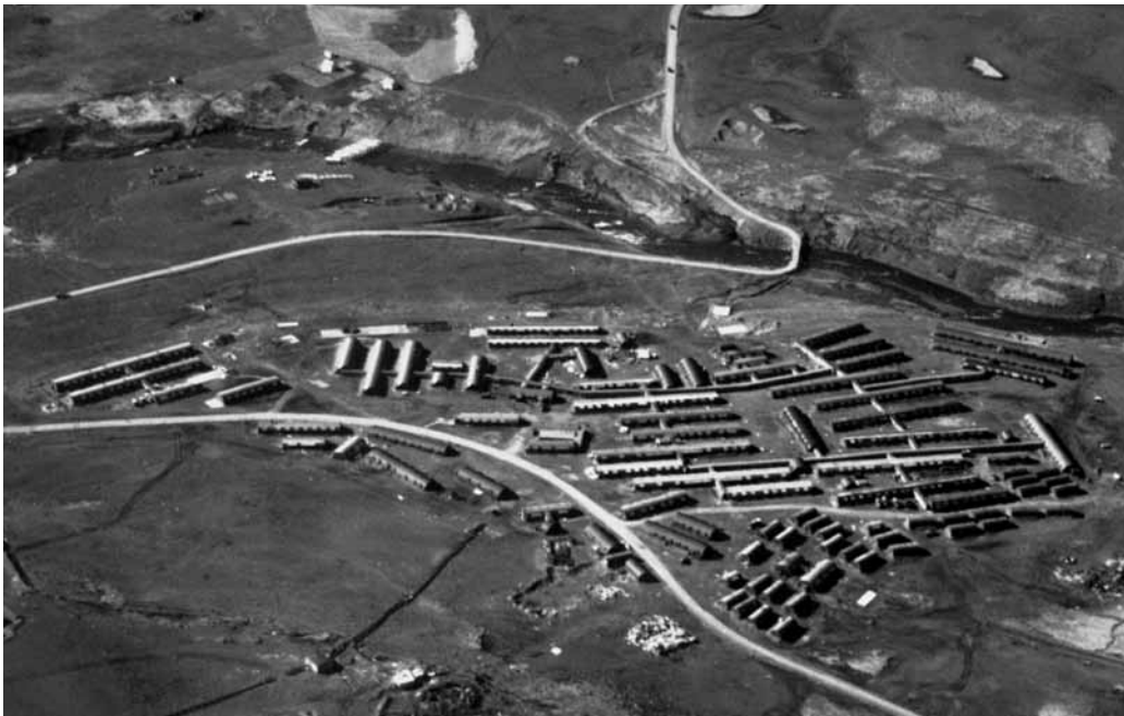
Helgafellsspítali við gatnamót Vesturlandsvegjar og Þingvallavegjar árið 1942.