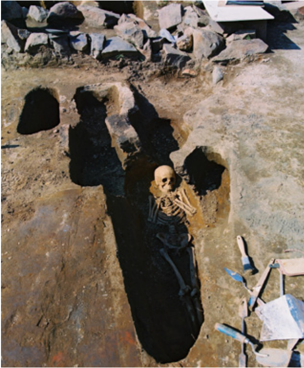
Gröf nr. 46. Beinásafnið er einstakt og ber þess skýr ein-kenni að vera úr kirkjugarði sjúkrastofnunar að sögn Steinunnar.