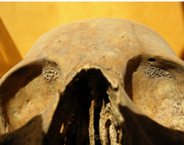
Ummerki í augntóftum eftir skyrbjúg.

Sagan af klaustrinu á Skriðu, bls. 246-7.