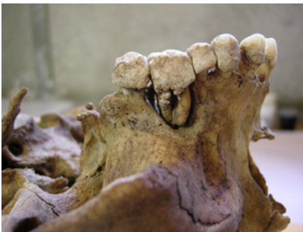
Ummerki um alvarlega ígerð í gömi.

„Eftir siðaskiptin verður hrun í þessari samfélagsþjónustu, ekkert kemur í stað hennar, og allar heimildir sýna að fólk á flakki og vergangi fjölgaði, þjófnaðir stórjukust, aðallega var þó stolið mat, og yfirvöld brugðust við með Stóradómi, refsingar voru hertar og dauðarefsingar teknar upp sem ekki höfðu tíðkast í kaþólskum sið. Myrkustu aldir Íslandssögunnar renna upp í kjölfarið.“