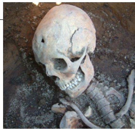
Gatið á höfuðkúpunni er eftir sárásótt. Mynd Skriðuklaustursrannsóknir.