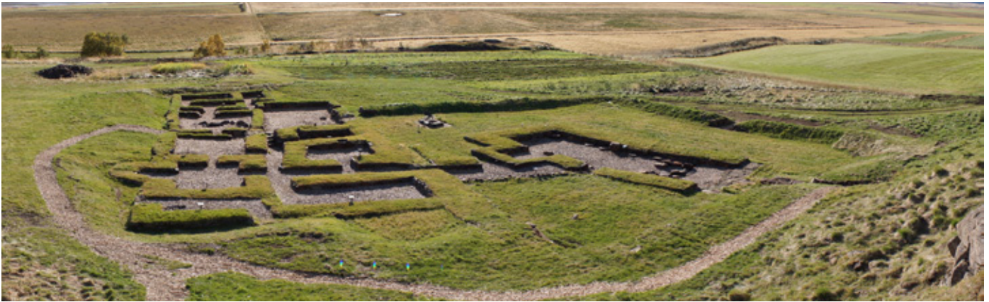
Svona lítur uppgraftarsvæðið út í dag.

geymdi mikilvægar upplýsingar um heilsufar almennings og aðbúnað við líkn og hjúkrun, sem og daglegt líf á miðöldum. Átti uppgröftur á honum eftir að varpa skýrara ljósi á hlutverk klaustursins en nokkur þorði að vona. Um leið kom í ljós að umsvif þess voru önnur og fjölbreyttari en áður hafði verið talið. Það var fjarri því að reglubræðurnir hefðu setið þar í myrkvuðum kytrum, hoknir við bókaskrif sín. Öðru nær. Ég tel nú að rannsóknin öll veiti innsýn í heim miðalda frá öðru sjónarhorni en ritaðar heimildir hafa gefið tilefni til.