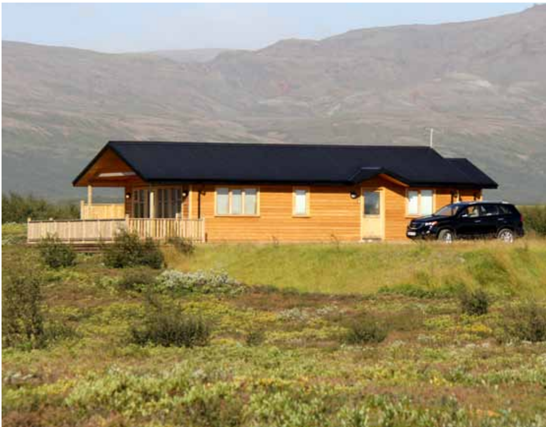
Nýjasti orlofsbústaður Læknafélagsins að Brekkuheidi 29 í Brekkuskógi austan við Laugarvatn. Þess ber að geta að billinn á myndinni fylgir ekki með húsinu.