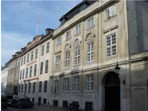
Mynd 3. Fæðingahóspítali (nær) og Smábarnastofnunin (fjær) í Amalieyötu, Kaupmannahöfn