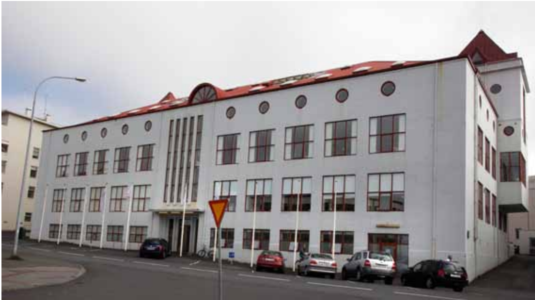
Mynd 11. Borgartún 6. Þar framleiddi Lyffjaverslun ríkisins innrennslislyf, stungulyf og önnur lyf frá árinu 1954 og til loka sjálfstæðrar starfsemi fyrirtækisins árið 1998 (sbr. texta).