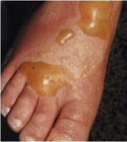
Mynd 5. Myndin sýnir dæmigerðar blöðrur á fæti sjómanns sem varð fyrir sinnepsgasi úr lekum sprengjum við veiðar í Eystrasalti.