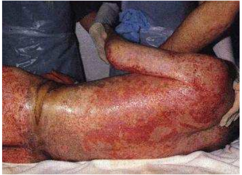
Mynd 6. Myndin sýnir útbreidda áverka eftir sinnepsgas á húð íransks hermanna, sem kom til meðferðar á sænskum spítala í ófriðnum á milli Íraks og Írans á árunum 1982-1988. Myndin er fengin að láni af slóðinni: http://www.opcw.org/about-chemical-weapons/types-of-chemical-agent/mustard-agents/ og birt með heimild frá Organisation for the Prohibition of Chemical Weapons (OPCW).

Síðla árs 1943 gerðu Þjóðverjar loftárás á skip Bandamanna í höfninni í Bari á sunnanverðri Ítalíu. Í árásinni var ekki færri en sextán skipum sökk. Meðal þeirra var bandarískt herflutningaskip (USAT John Harvey) sem hlaðið var um 100 tonnum af sinnepsgassprengjum auk sprengiefna. Skipið nánast sprakk í sundur og allir um borð dóu. Í höfninni voru einnig olíuskip og úr þeim flóði olía. Sinnepsgas blandaðist í olíuna og ýmist brann með henni eða hélst í olíubrákinni þar sem ekki brann. Þjórgunarmenn gerðu sér ekki ljóst að sinnepsgas væri í olíunni. Þess var því ekki gætt sem skyldi að fjarlægja fót og þvo olíuna af þeim sem bjargað var úr höfninni. 5 Talið er að 617 hafi fengið sinnepsgaseitrun í árásinni og af þeim dóu 83, helmingurinn úr öndunarfarasýkingum samfara hvítkornafæð. 5