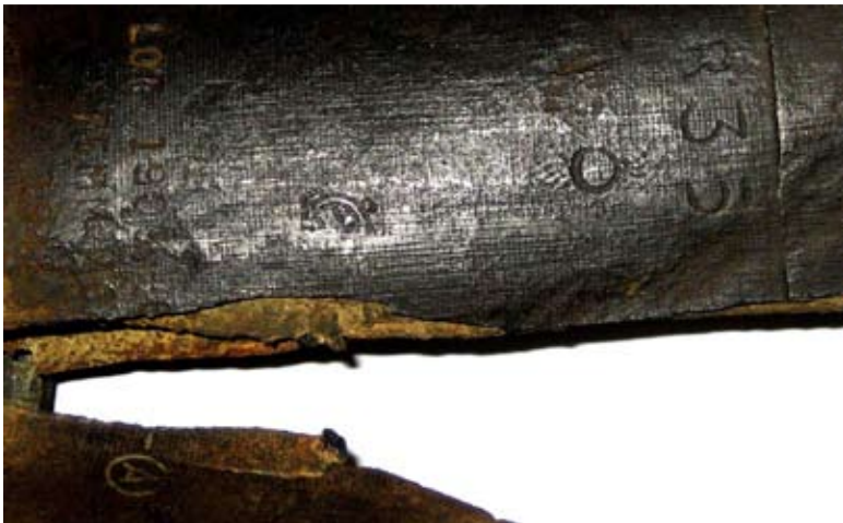
Mynd 4. Myndin sýnir óljóst merki í málminum á ytra byrði sinnepsgassprengjunnar (sbr. mynd 2). Reynt var á sínum tíma að lesa úr þessum merkjum til þess að rekja hvaðan sprengjan væri komin. Myndin er tekin í RLE 20.10.2008.