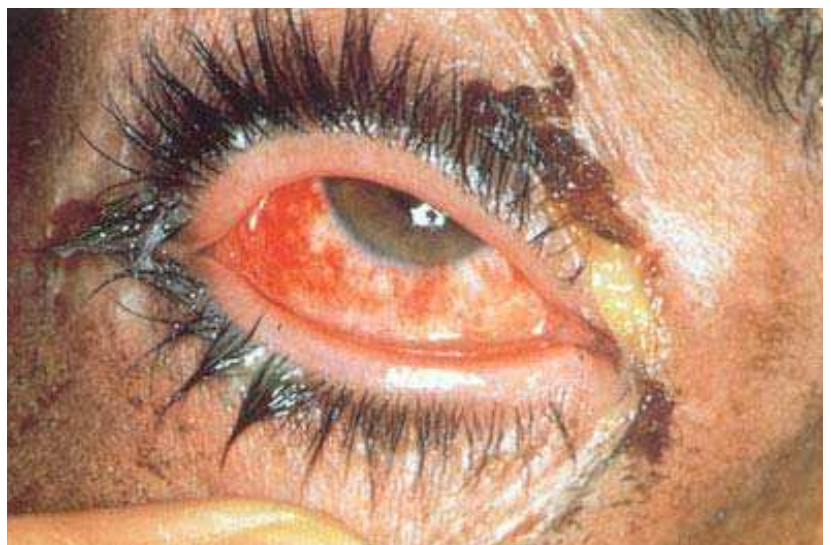
Mynd 7. Slímhimnubólga í auga og þrútin augnlok hjá manni sjö dögum eftir áverkun sinnepsgass. Myndin er fengin að láni úr: Willems JL. Clinical management of mustard gas casualties. Ann Med Milit Belg 1989; 3 (supplement 1): 1-61, og birt með leyfi höfundar.

Klóralk (kalcíumhýpóklórít) gengur í samband við TTS og breytir í síður skaðleg efni (saltsýru, koltvíoxíð, brennisteinstvíoxíð og alkýlklóríð) samfara hitamyndun. Enn betra er að nota magnesíumoxíð í blöndu við klóralk, en magnesíumoxíð bindur TTS og flýtir fyrir efnahvörfum þess við klóralk. 12 Alls staðar þar