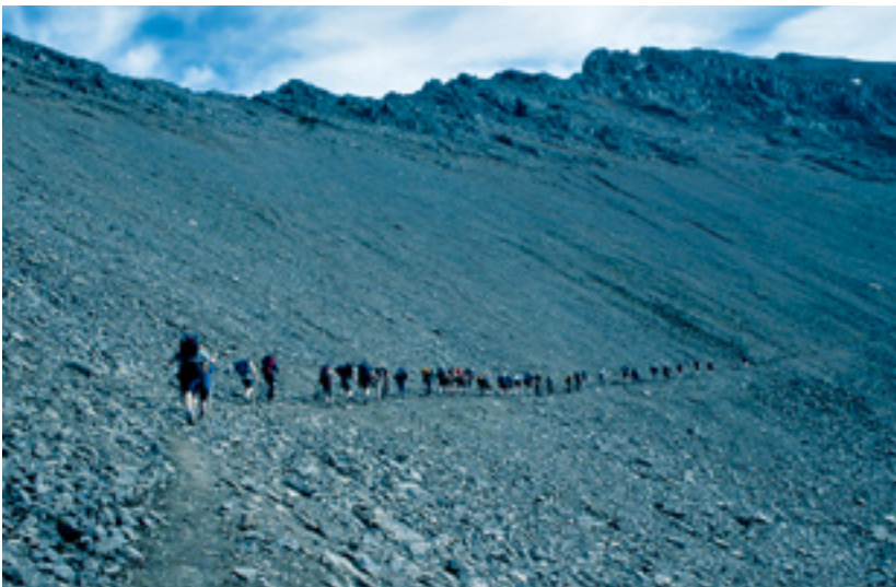
Gönguhópur í Fjörðum þræðir einstigi undir leiðsögn Valgarðs.