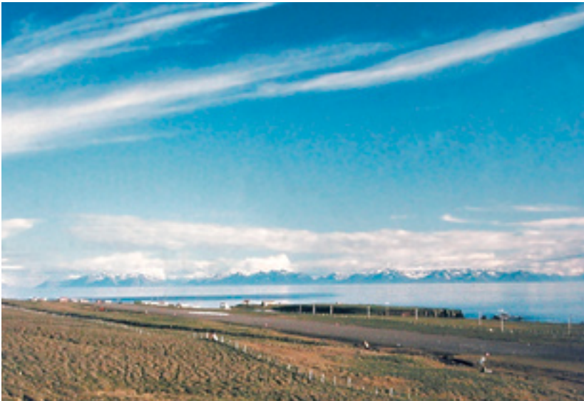
Fjörður og Flateyrdalur séð utan úr Grímsey.

við örnefnagift þá eru menn að persónugera landið um leið. Auðvitað er margt annað sem hefur áhrif en þetta er eitt helsta einkenni örnefnagiftar. Allir drangar heita „karlar“ og „kerlingar“, sker heita „sveinar og systur“, „kerling“ og „jómfrú“ eru beint fyrir ofan Akureyri og þannig má áfram telja. Svo er svipur á fjöllum sem þau taka nafn af, „yggla“ og nær allir líkamshlutar mannsins eiga sér samsvörun í örnefnum. Það er nánast hægt að byrja á hvirflinum og fíkra sig niður eftir líkamanum og alls staðar finnast hliðstæður í örnefnum. Höfuð, hnakki, hvirfill, enni, brúnir, augu, nef, nasir, kinn, kjálki, háls, axlir, bringa, hryggur, lend, mjöðm, eistu, læri, hné, sköflungur, hæll, rist, il, tá svo fátt eitt sé nefnt. Og síðan eru öll örnefni sem draga nafn af búsmalanum. Sjálfur man ég eftir því að hafa persónugert allt í kringum mig og var alinn upp við slíka hugsun; manni fannst vindurinn hafa sjálfstæðan vilja og ætla að rífa þakið af húsinu og bólgna lækirnir á vorin voru staðráðnir í að brjótast yfir bakkana og dreifa möl og aur um gróið land. Allt var lifandi í kringum mann og birtist í nafngiftum á landslagi og fyrirbærum náttúrunnar. Landið fær allt aðra mynd í huga manns þegar örnefni eru kunn.”