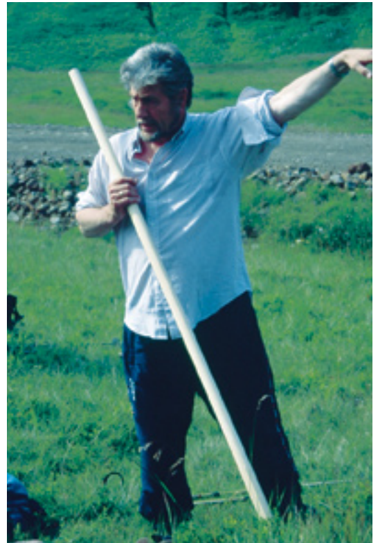
Styrkur göngustafur sem einnig má nota til að verjast útleikumönnum.