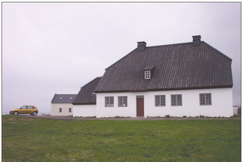
Nesstofa á Seltjarnarnesi. Húsið sem sést í lengst til vinstri á myndinni er Lyfjafraeðisafnið en þar er einnig félagsaðstaða lyfjafraeðinga.