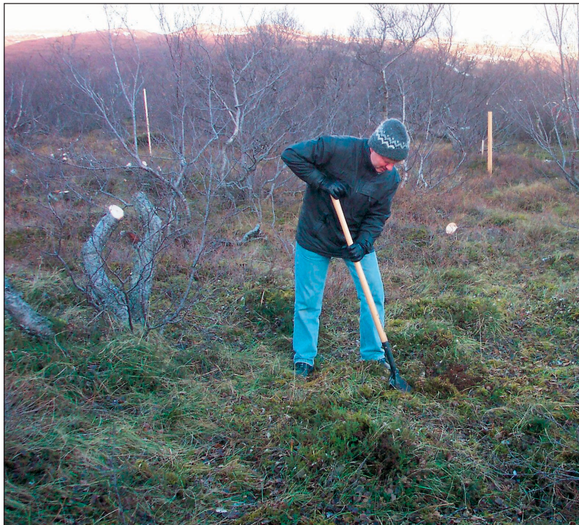
Sigurbjörn Sveinsson formaður LÍ tekur fyrstu skóflustunguna að nýju orlofshúsi félagsins í landi Húsafells.

Húsið á að kosta 15 milljónir króna fullbúið en án húsgagna. Smíði þess á að ljúka um miðjan maí þannig að unnt verði að taka það í gagnid eigi síðar en 1. júní næsta sumar.