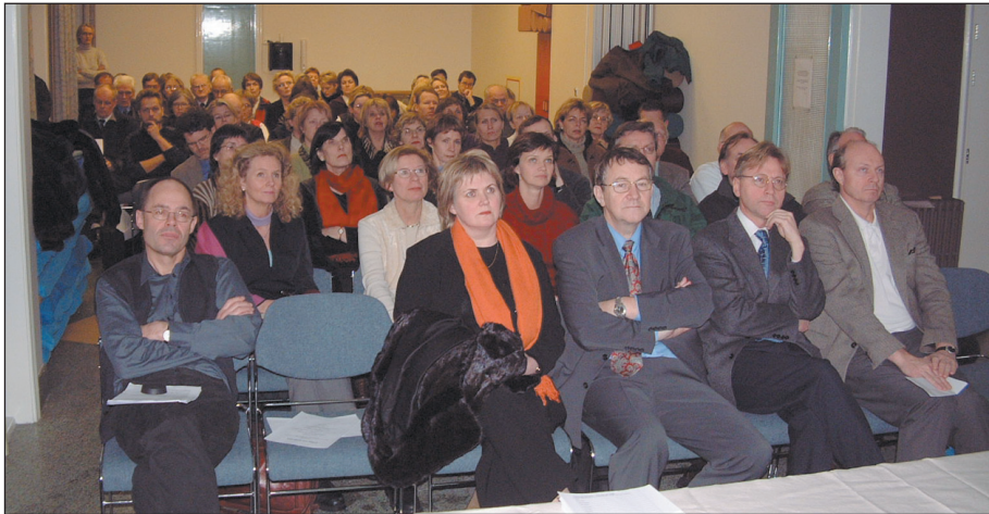
Frá stofnfunði Félags um lýðheilsu sem haldinn var í Heilsuverndarstöðinni 3. desember síðastliðinn. Ljós. Samúel J. Samúelsson.