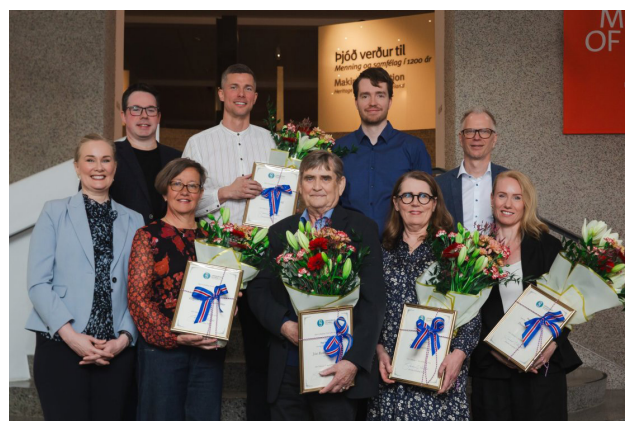
Hópurinn með viðurkenningar sínar og formaður LÍ.

Dagur lækna var í þriðja sinn haldinn þann 17. maí síðastliðinn, að þessu sinni í Þjóðminjasafninu. Stjórn Læknafélags Íslands (LÍ) og stjórn nýstofnaðs Lækningaminjasjóðs Jóns Steffensen stóðu að fundinum.