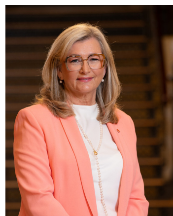
Alma Möller heilbrigðisráðherra.

Spurð að lokum um hvort núverandi innviðir heilbrigðis- og neyðarþjónustu séu nægilega öflugir til að mæta þeim fjölda fólks sem búist er við á landinu