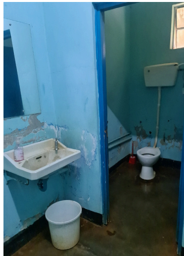
Starfsmannaklósettið á sjúkrahúsinu í Kiambu.

Tveimur árum síðar, þegar ég var á fjórða ári í náminu, veiktist pabbi alvarlega. Hann lá lengi inni á Landspítala, á deildum þar sem ég var sjálf í verknámi, sat fundi þar sem hans mál voru rædd, ekki sem aðstandandi heldur nemi. Samnemendur skrifuðu dagálana hans og ég var föst á milli tveggja hlutverka, sem nemi og sem barn innliggjandi skjólstaðings. Hann náði ekki að sigrast á