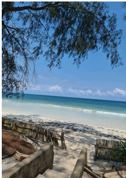
Diani ströndin í Kenía er falleg.