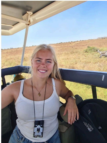
Safari í Nairobi þjóðgarðinum.