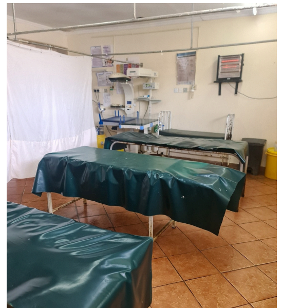
Fæðingarstofan, allt að þrjár saman að fæða.