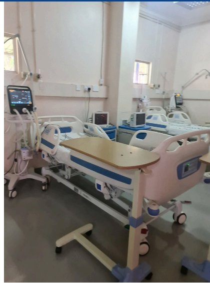
Gjörgæsludeild sjúkrahússins í Kiambu.