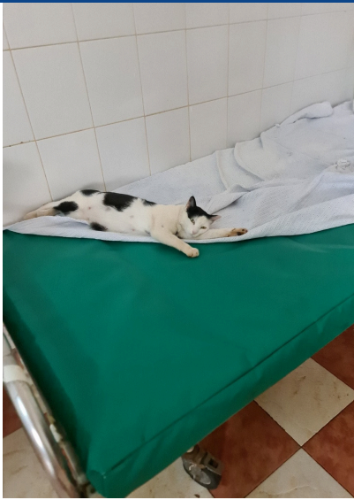
Skoðunarherbergið á kvemnadeildinni á sjúkrahúsinu í Kiambu.