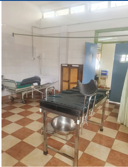
Aðstaðan fyrir kvenskoðun á kvemnadeild sjúkrahússins í Kiambu.