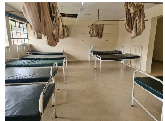
Hér eru konurnar í hriðum, fyrir fæðingu barnsins.