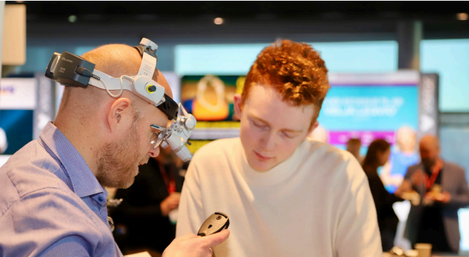
Tækni og nýjungar fengu sinn sess á Læknadögum í ár.