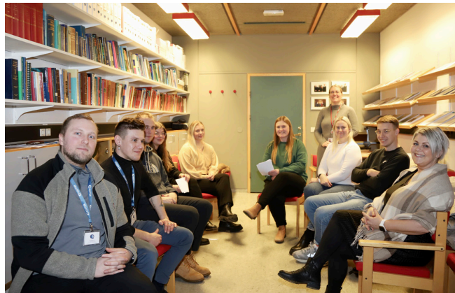
Læknanemar og hjúkrunarfræðingar á starfsþróunarári fóru í gegnum hermikennslu í samskiptum með túlki og á fjölskyldufundum í læknadeild.

„Læknar hafa því verið settir í þá stöðu að leiða þessa fundi án undirbúnings og það er það sem við erum að breyta með þessari kennslu,“ segir hún.