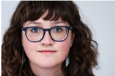
Kristín Svava Tómasdóttir