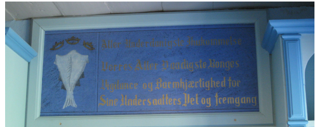
Mynd 1. Fiskurinn og þakkarorð yfir dyrum.