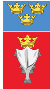
Mynd 6. Teikning: Matthias Á. Jóhannsson.