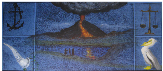
Mynd 3.