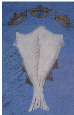
Mynd 2. Þríkrýndi fiskurinn.