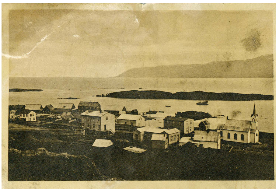
Póstkortíð frá 1921, mynd af kaupúinunin á Vopnafirði.

gripið til, þegar skár lá á manni, til þess að stytta stundir og veginn.